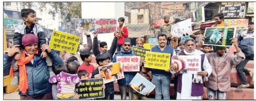
चाइनीज मंझे के विरोध में गिरजाघर पर प्रदर्शन करते कांग्रेसी