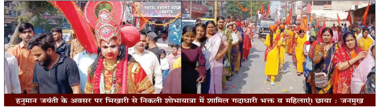
हनुमान जयंती के अवसर पर भिखारी से निकली शोभायात्रा में शामिल गदाधारी भक्त व महिलाएं