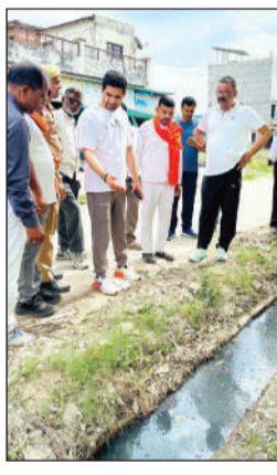
वाराणसी (जनमुख डेस्क)। बरसात के दौरान शहर को जलभराव की समस्या से निजात दिलाने और जल निकासी व्यवस्था को सुचारु बनाने के लिए सोमवार को महापौर