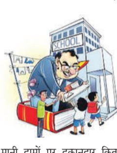
स्कूल व कालेजों को चेतावनी देते हुए उन्होंने कहा है कि ऐसा करने वालों के खिलाफ सख्त से सख्त कार्रवाई सीधे स्कूल प्रिंसिपल और मैनेजर पर होगी। दरअसल, स्कूलों की इस मनमानी की शिकायतें लगातार उच्चाधिकारियों व शासन स्तर पर हो रही हैं। अब प्रदेश में नए शैक्षिक सत्र शुरू होते ही निजी स्कूलों की फीस और अन्य व्यवस्थाओं को लेकर शासन ने सख्त रुख अपना लिया है। DIOS ने कहा है कि सभी स्वतंत्र पोषित विद्यालयों में फीस निर्धारण पूरी तरह नियमों के तहत ही किया जाए और किसी भी प्रकार की मनमानी बर्दाश्त नहीं की जाएगी।

वाराणसी। प्राइवेट स्कूलों में कमीशन के चक्कर में बच्चों को किताब व ड्रेस अपने ही परिचित दुकान से लेने का दबाव बनाया जाता है। यही कारण है कि मन-