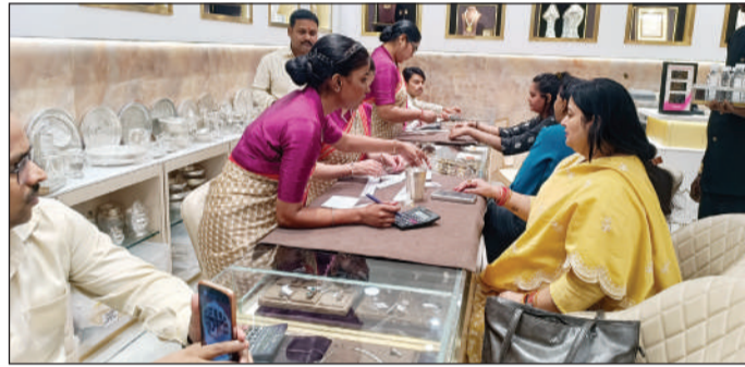
के आकर्षक एवं प्रमाणित आभूषणों की विस्तृत श्रृंखला उपलब्ध होगी, जो हर खास अवसर को और भी यादगार बनाएगी। नया शोरूम आधुनिक सुविधाओं, सुसज्जित वातावरण और व्यक्तिगत ग्राहक सेवा के साथ एक

रथयात्रा पर चेतमणि जेम्स एण्ड ज्वेल्स का पुनः शुभारम्भ