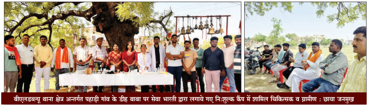
बीएलडब्ल्यू थाना क्षेत्र अन्तर्गत पहाड़ी गांव के डीह बाबा पर सेवा भारती द्वारा लगाये गए निःशुल्क कैम्प में शामिल चिकित्सक व ग्रामीण