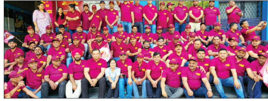
पीएनबी के स्थापना दिवस के अवसर पर सोलजराथन दीड़ में भागीदारी करते गोरखा रेजिमेंट के सैनिक व अन्य।