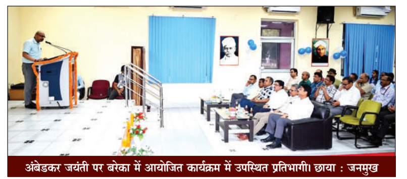
अंबेडकर जयंती पर बरेका में आयोजित कार्यक्रम में उपस्थित प्रतिभागी