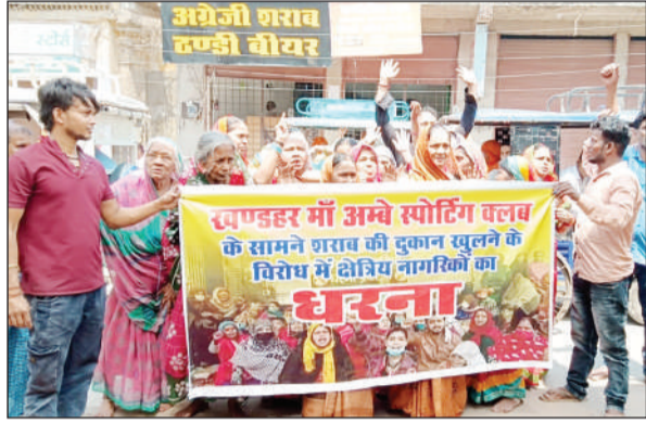
रूप में देखा जाता था, वहीं अब शराब की दुकान खुलने से लोगों

वाराणसी (जनमुख डेस्क)। आदमपुर थाना क्षेत्र के प्रहाद घाट पर शराब और बीयर का ठेका खुलने के बाद स्थानीय नागरिकों में गहरा असंतोष फैल गया है। जिस स्थान को अब तक धार्मिक और सामाजिक गतिविधियों के केंद्र के