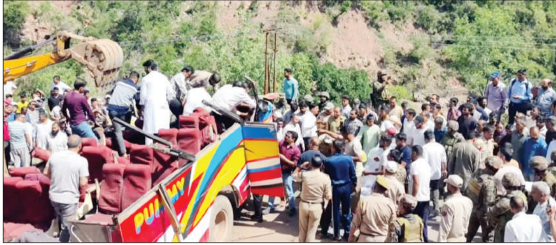
सहायता देने की घोषणा की है। रामनगर-उधमपुर मार्ग पर सोमवार सुबह एक भीषण सड़क हादसे में तेज रफतार और अनियंत्रित होकर यात्री बस बनकर सामने आई है। कघोटे इलाके में एक मोड़ पर अनियंत्रित होकर यात्री बस करीब 70 से 80 फीट गहरी खाई में गिर गई, जिसमें 20 से अधिक लोगों की मौत की अपुष्ट आशंका जताई जा रही है। वहीं 30 से ज्यादा लोग घायल बताए जा रहे हैं। बस जेके 14 डी 2121 सुबह रामनगर से ऊधमपुर आ रही थी। बस में बड़ी संख्या में यात्री सवार थे, जिनमें सरकारी कर्मचारी, स्कूल व कालेज के शिक्षक और विद्यार्थी शामिल बताए जा रहे हैं। सुबह 9:40 बजे बस चालक ने कघोटे इलाके में मोड़ काटते समय बस से अपना नियंत्रण खो दिया। जिससे बस सड़क से 80 मीटर नीचे पलट कर उलटी होकर गिरी और बुरी तरह से क्षतिग्रस्त हो गई। हादसे में बस की ध्वजियां बिखर गयीं। दुर्घटना के बाद मौके पर चीख-पुकार मच गई और स्थानीय लोग तुरंत राहत कार्य में जुट गए।