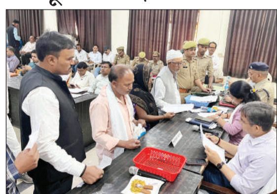
पीडब्ल्यूडी सहित कुल 121 मामले