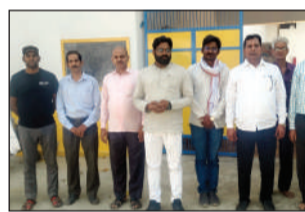
विश्वकर्मा शिल्पकार समाज की

सामाजिक सुरक्षा की गारंटी के लिए एससी एसटी उत्पीड़न निवारण अधिनियम की भांति कानून बनाया जाए। बैठक में निर्णय लिया गया कि समाज को संगठित और सशक्त करने के लिए देश भर में सामाजिक पुनर्जागरण एकता अभियान चलाया जाएगा।