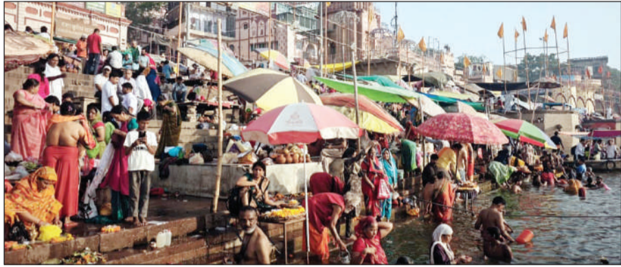
वाराणसी। अक्षय तृतीया की तिथि रविवार की दोपहर में ही लग गई लेकिन उदया तिथि का मान होने से अक्षय तृतीया सोमवार यानी आज मनाई जा रही है। हालांकि, कुछ लोगों ने तिथि की

उदया तिथि का मान होने से आज भी मनायी गयी अक्षय तृतीया