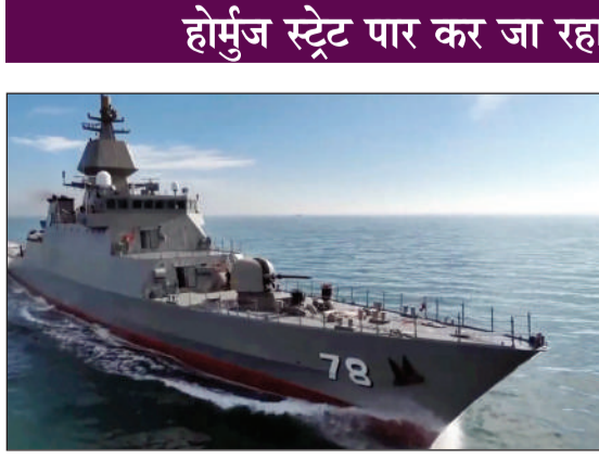
मुताबिक, जहाज ने चेतावनियों को नजरअंदाज किया, जिसके बाद अमेरिकी मरीन ने उसे रोक लिया। उन्होंने सोशल मीडिया पर लिखा, 'इस वक्त जहाज हमारे कब्जे में है। हम पूरी तरह

● ईरान ने कहा-ये सीजफायर का उल्लंघन है जल्दी ही जवाब देंगे