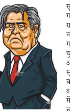
है। दरअसल, चुनाव आयोग के आदेश पर बंगाल में मतदाता

कोलकाता। पश्चिम बंगाल में मतदाता सूची के विशेष गहन पुनरीक्षण को लेकर एक बड़ा विवाद सामने आया है। चुनाव ड्यूटी पर तैनात 65 अधिकारियों के नाम ही मतदाता सूची से हटा दिए गए। इनके नाम राज इन् अधिकारियों ने शुक्रवार को सुप्रीम कोर्ट में याचिका दायर की है। दरअसल, चुनाव आयोग के आदेश पर बंगाल में मतदाता