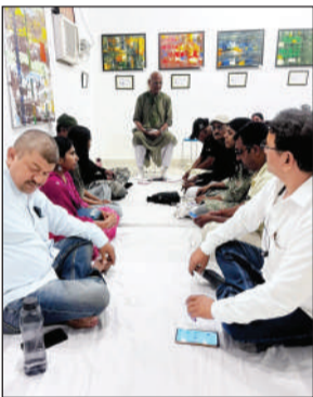
कार्यशाला में कही। उन्होंने कहा कि तकनीक आपको एक अच्छी तस्वीर दे सकती है, लेकिन संवेदनशीलता समझ जरूरी है।

● छाप छोड़नी है तो सीखनी होगी तकनीकी और संवेदना के गुर