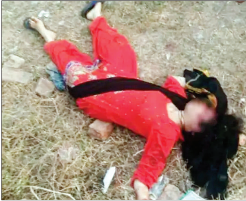
वाराणसी। वाराणसी में कूचकर हत्या कर दी। हत्या के थाना क्षेत्र के खेतों में फेंक हमलावरों ने महिला की सिर बाद उसके शव को लोहा दिया। पहचान मिटाने के लिए

रेप के बाद मर्डर की आशंका, मौके पर पहुंची फॉरेंसिक टीम