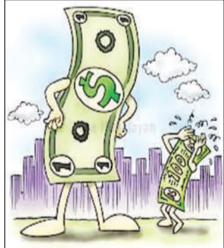
मुद्रा विनिमय बाजार में गुरुवार को रुपया ९५.०१ पर खुला और जल्द ही ३२ पैसे का गोता लगाकर ९५.२० पर पहुंच गया। इससे पहले बुधवार को भी रुपया २० पैसे गिरकर ९४.८८ के निचले स्तर पर बंद हुआ था। पश्चिम एशिया संकट के कारण वैश्विक ऊर्जा बाजार में मची उथल-पुथल के बीच भारतीय शेयर बाजार के बेंचमार्क सूचकांक एक बार फिर फिसल गए हैं। गुरुवार को शुरुआती कारोबार में सेंसेक्स और निफ्टी जैसे प्रमुख सूचकांकों में गिरावट दर्ज की गई। शुरुआती कारोबार में सेंसेक्स ९५९.२२ (-१.२३%) अंकों तक टूट गया और ७६,५३७.१४ के स्तर पर पहुंच गया। दूसरी ओर, एनएसई निफ्टी -२८५.६६ (-१.१८%) अंक कमजोर होकर २३,८९२.०० के स्तर पर पहुंच गया।

नई दिल्ली। डॉलर के मुकाबले भारतीय रुपया गुरुवार को शुरुआती कारोबार में ३२ पैसे टूटकर ९५.२० के सर्वकालिक निचले स्तर (ऑल-टाइम लो) पर आ गया है। इस भारी गिरावट के पीछे मुख्य रूप से अंतरराष्ट्रीय बाजार में कच्चे तेल की बढ़ती कीमतें, मजबूत अमेरिकी डॉलर और पश्चिम एशिया में गहराता भू-राजनीतिक तनाव के चलते मुद्रा बाजार में हाहाकार मचा है। अंतरबैंक विदेशी