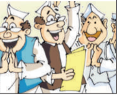
जिला स्तर पर मतदाता सूची प्रकाशित की गई है। आयोग ने 23 दिसंबर को अंतिम मतदाता

● मतदाताओं को नौ अंकों का नया स्टेट वोट नंबर लखनऊ। राज्य निर्वाचन आयोग ने त्रिस्तरीय पंचायत चुनाव की मतदाता सूची का अंतिम प्रकाशन बुधवार को कर दिया है। जिलों में