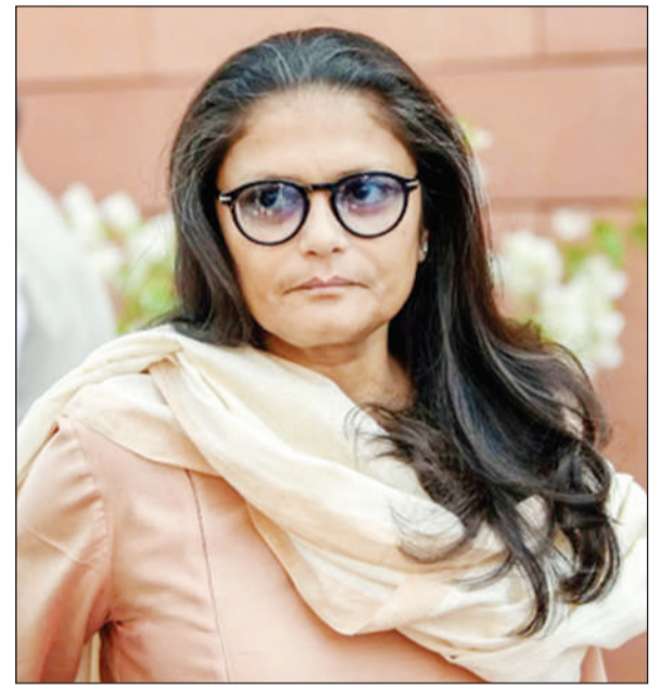
चुके हैं। लगातार हो रहे इस्तीफों से साफ संकेत मिल रहे हैं कि तृणमूल कांग्रेस के अंदर असंतोष तेजी से बढ़ रहा है। असम के

● मुख्य सचेतक रहे सुखेंद्र शंकर राय पहले ही पार्टी छोड़ चुके नई दिल्ली। तृणमूल कांग्रेस में जारी अंदरूनी संकट अब और गहरा होता दिखाई दे रहा है। पार्टी की राज्यसभा सांसद सुष्मिता देव ने अपने पद से इस्तीफा देकर ममता बनर्जी खेमे को एक और बड़ा झटका दे दिया है। पिछले कुछ दिनों से पार्टी के भीतर बगवत की खबरें लगातार सामने आ रही थीं और अब सुष्मिता देव के इस्तीफे ने इस संकट को और गंभीर बना दिया है। इससे पहले तृणमूल के वरिष्ठ नेता और राज्यसभा में लंबे समय तक पार्टी के मुख्य सचेतक रहे सुखेंद्र शंकर राय भी पार्टी छोड़