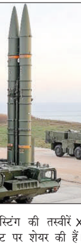
को टेरिफिंग की तस्वीरें X अकाउंट पर शेयर की हैं।

इसके साथ-साथ नेवल एंटी शिप मिसाइल-मीडियम रेंज का भी टेस्ट किया गया। इसे भारत की समुद्री स्ट्राइक और डिफेंस स्किल को मजबूत करने की दिशा में एक बड़ी उपलब्धि माना जा रहा है। भारत अब उन खास देशों के ग्रुप में शामिल हो गया है, जिनके पास ऑपरेशनल-लेवल की बैलिस्टिक मिसाइल डिफेंस क्षमता है। भारत से पहले यह तकनीक अमेरिका, रूस, इजरायल और चीन के पास थी।