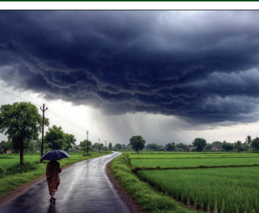
से ज्यादा राज्यों में बारिश का अलर्ट है। राजस्थान के 15 जिलों में आज बारिश हो सकती है। रविवार को

● 60 किमी की रफ्तार से चलेगी हवाएं भोपाल/जयपुर/लखनऊ/पटना। मानसून अब तक 19 राज्यों में पहुंच चुका है। अगले 48 घंटे में इसके मध्य प्रदेश में एंटी की संभावना है। प्रदेश के करीब 30 जिलों में आज आधी-बारिश का अलर्ट है। देश के कई राज्यों में प्री-मानसून एक्टिव है। मौसम विभाग के मुताबिक, आज 20