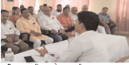
पोषण योजना के तहत चयनित 21 विद्यालयों में योजना का शत-प्रतिशत संचालन सुनिश्चित करने के लिए बर्तन, ईंधन और अस्थायी किचन की व्यवस्था करने के निर्देश दिए गए।

एक जुलाई से शुरू होगा पठन-पाठन, विद्यालयों की सफाई कर लें पूरी : डीआईओएस